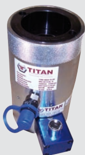
napinacz śrub fundamentowych