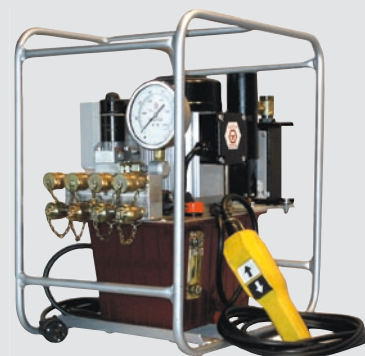
hydrauliczna pompa do kluczy dynamometrycznych z rewolucyjnym systemem "TITAN SMART TITE"

Titan jest innowacyjnym liderem w dziedzinie dokręcania precyzyjnego.