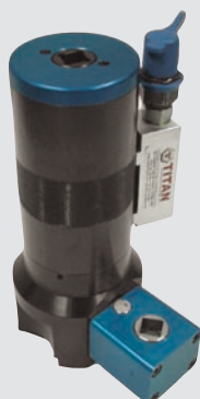
pojedynczy i podwójny tłok napinająco-dokręcający śruby