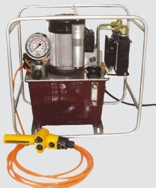
EXE 2000TT pompa elektryczna dla urządzeń napinających