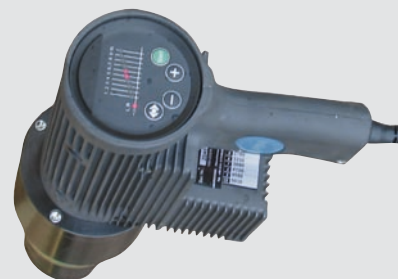
TITAN ETITE - elektryczne urządzenia dynamometryczne oraz SERIA TORQUE & ANGLE (dokręcanie pod kątem)